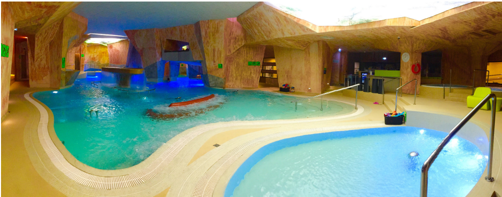
Viking kylpylän altaat.

Kansanlähetyksväki on tottunut pääosin uhraamaan ja uhrautumaan. Herramme varmaan suo meille myös irtiotoja arjesta ja kehon, sielun ja hengen virvoitusta - itsensä rakastamista.