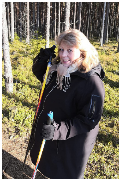
Virkistystä kropalle ja mielelle olen tarvinnut ja saanut. Kiitos Jumalan!

Yksityislahjoituksista 36 % kohdentuu tällä hetkellä piirin työlle Satakunnassa ja 64 % lähetystyölle. Erityiskiitos suurista yksittäisistä lahjoituksista piirin kotimaantyölle. Tästä on hyvä jatkaa. Jumalan rauhaa ja Pyhän Hengen läsnäoloa kesääsi!